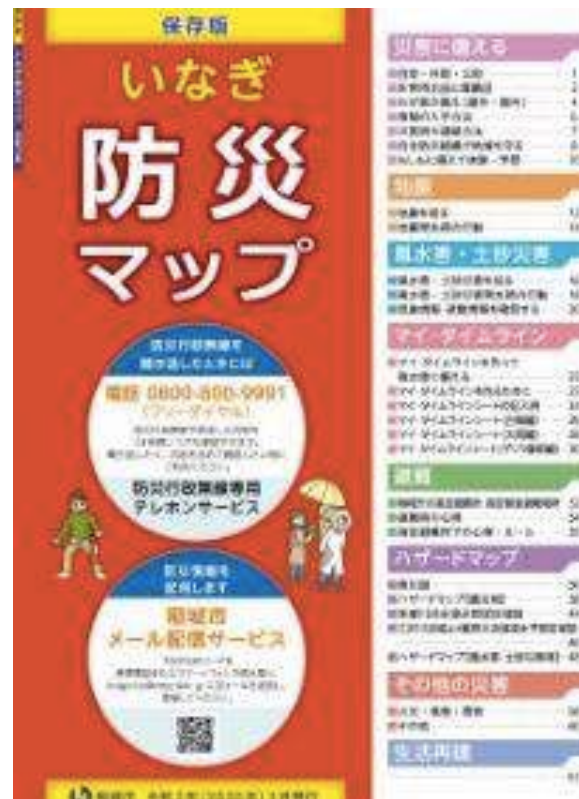
이나기시 홈페이지로 부터